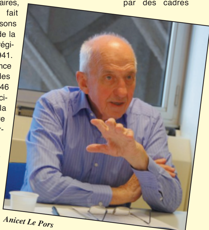
Anicet Le Pors

S'agissant de la revendication parfois évoquée d'un statut unique ou unifié. Je comprends que cette revendication a un fondement légitime : des textes comme la loi Galland du 13 juillet 1987 ont introduit ou développé des différences entre fonctions publiques et notamment entre les fonctionnaires territoriaux et les fonctionnaires de l'État, par exemple, en remplaçant les corps par des cadres