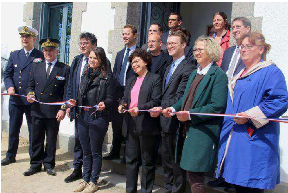
Où sont les agents brestois de l'OFB ? Cherchez bien !